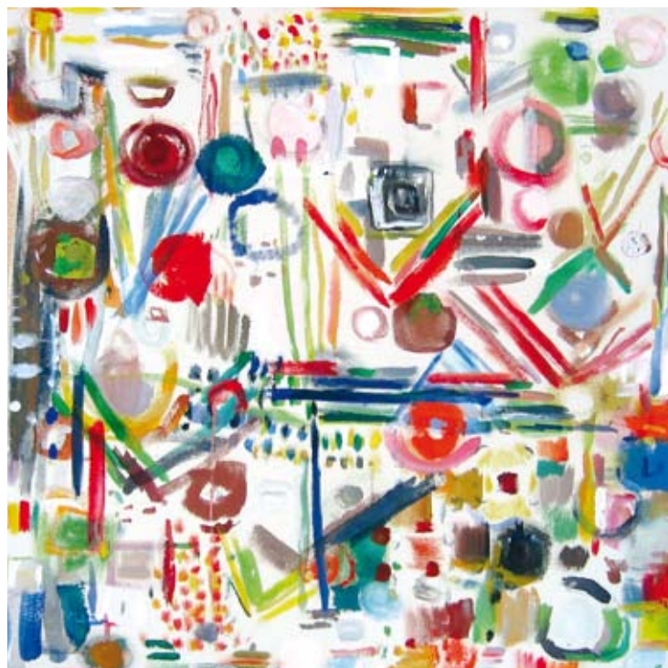
peinture : guillaume lebel, gouache, 2006, 60x60 | graphisme : stéphane berland

impression : taag, grigny. ne pas jeter sur la voie publique.